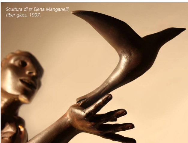
Scultura di sr Elena Manganelli, fiber glass, 1997.

Educatori, operatori pastorali, insegnanti, genitori